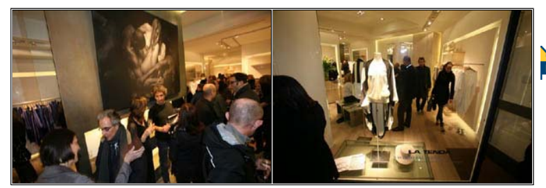
(Cliccare sulle immagini per ingrandire)

Si desea hacernos llegar algún comentario sobre esta información, no dude en ponerse en contacto con moditalia@moditalia.net .