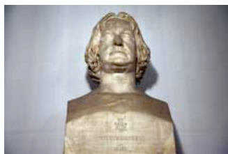
Busto di Thorwaldsen

Detta är ett utrymme ägnat åt möten med Skandinaviska Föreningens Konstnärshus i Rom. Här hittar ni intervjuer (på originalspråk med översättningar till italienska), foton och artiklar från händelser som vi har följt åt er med betydelsefulla artister och intellektuella från Skandinavien (Island, Norge, Sverige Finland och Danmark).