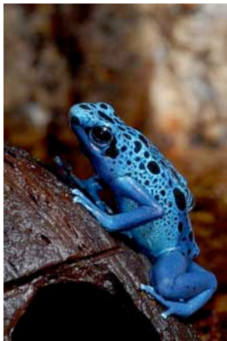
Rana dendrobatide