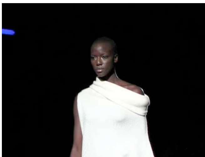
Alcuni momenti della sfilata, foto di Rodolfo Mazzoni