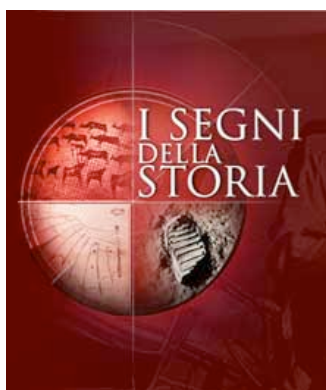
Logo festival, foto stampa

Si è svolto a Roma dal 18 al 21 Febbraio 2009 il Primo Festival del Documentario Storico. La manifestazione è stata pensata e voluta dall'Istituto Luce, da Rai Educational e da History Channel per valorizzare il patrimonio e i molti personaggi storici oggetto dei racconti cinematografici di grandi documentaristi.