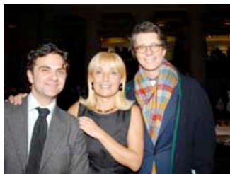
La Presidente di AltaRoma Fiorucci con l'A.D. Franchi

Al Tempio di Adriano la primissima edizione di "Fashion on Paper",