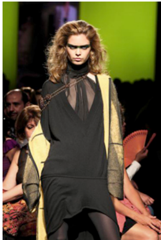
Wholegarment by Saverio Palatella

Roma assiste alla sfilata-evento di Saverio Palatella. La sua collezione Wholegarment by Saverio Palatella incanta il pubblico con un eco design caldo, a tratti semplice e confortevole, dove glamour moderno e ricca naturalità si fondono armoniosamente. L'abbigliamento sportivo contemporaneo è accostato ad elementi sartoriali couture e maglie techno in cashmere dal volume rassicurante.