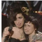
Grammy 2008. I vincitori