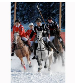
Saint Moritz: Polo e Champagne