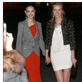
Parigi Haute Couture. I vip in prima fila