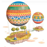
Vanni Cuoghi L'amore disparato