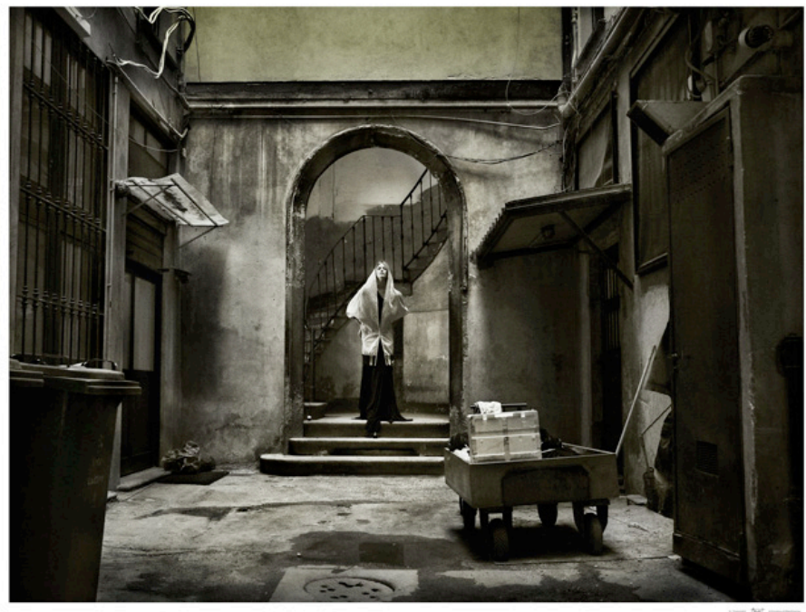
Wholegarment by Saverio Palatella