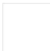
ADV: Bottega Veneta SS 2011